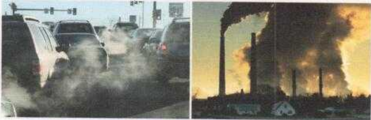
वायु प्रदूषण — वाहनों, कारखानों से निकलता धुआं

वायु प्रदूषण के कुप्रभावों से बचने के लिए यह आवश्यक है कि इससे सम्बन्धित कुछ नियम बना दिए जाएं। इस सम्बन्ध में भारत में सन् 1971 में 'वायु प्रदूषण निवारण और नियंत्रण अधिनियम' बनाने पर विचार किया गया। सन् 1981 में पर्यावरण निवारण और नियंत्रण कानून लागू किया गया। नेशनल इन्वारेन्मेण्ट इंजीनियरिंग रिसर्च इंस्टीट्यूट (NEERI) नागपुर, परमाणु ऊर्जा आयोग इस दिशा में महत्वपूर्ण कार्य कर रहे हैं। नीरी कई महानगरों में वायु प्रदूषण से सम्बन्धी आँकड़ों को एकत्रित कर रही है। इस संस्थान ने निष्कर्ष निकाला है कि कुछ नगरों के नाइट्रोजन आक्साइड के संकेन्द्रण की प्रवृत्ति में अन्तर आया है।